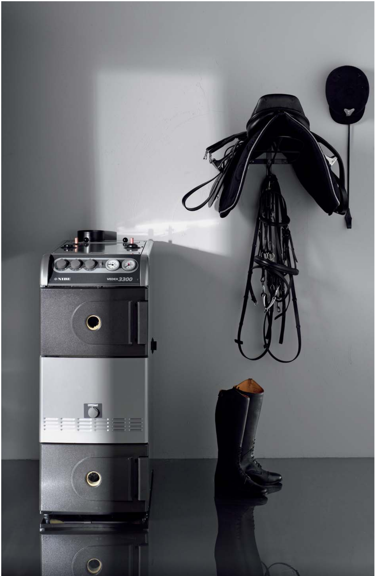
NIBE VEDEX 3300