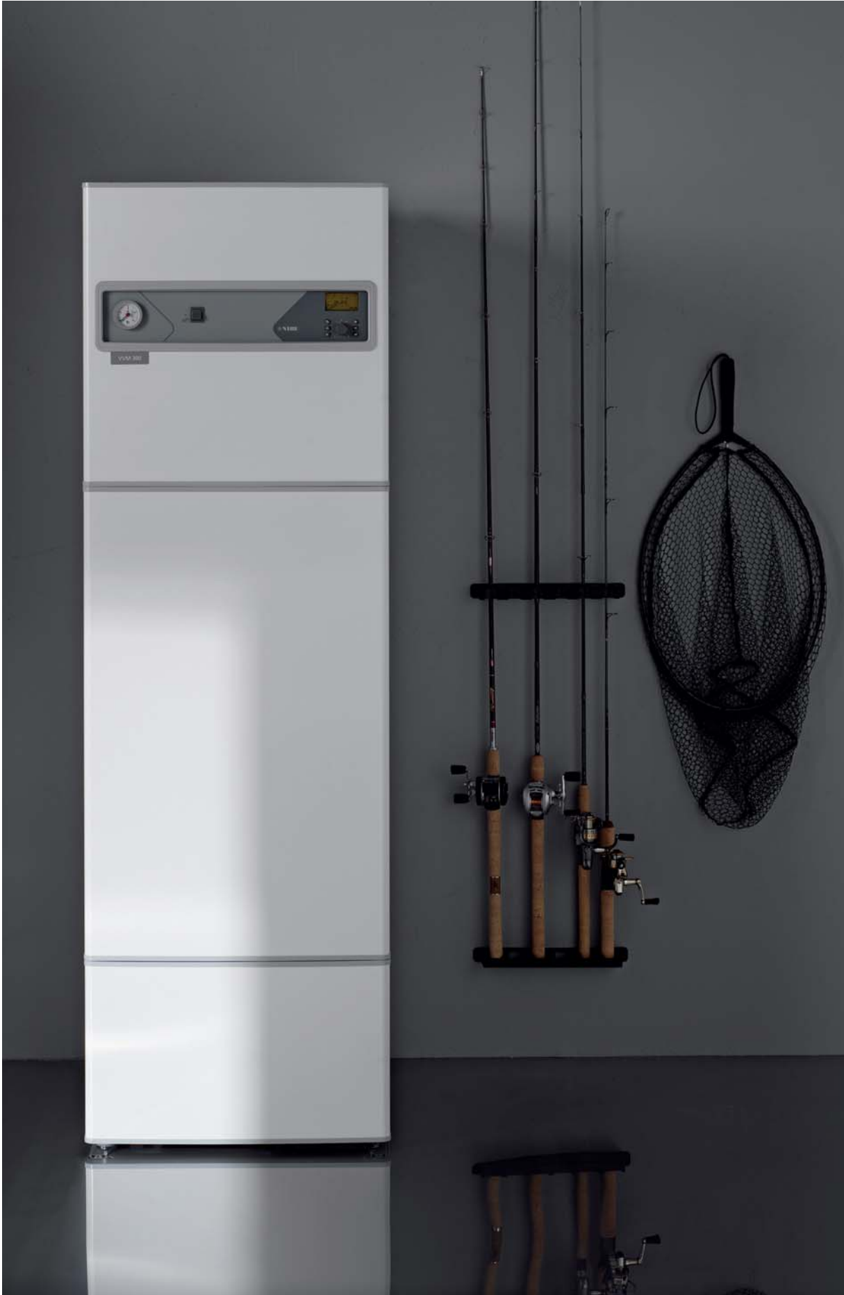
NIBE VVM 300